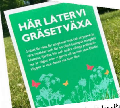
Genom att klippa gräset lite mindre ofta ger vi insekterna och växterna en chans att frodas.

Genom att omvandla vissa gräsytor till ytor med högre gräs ger vi bin, fjärilar och andra pollinatörer en bättre plats att hitta mat och bo på. Det är ett viktigt steg för att bevara den biologiska mångfalden i vår stad. Utvalda ytor skyltades upp med information. Projektet pågår ett år och har utvärderats halvvägs med mycket gott utfall efter sommarsäsongen 2024.