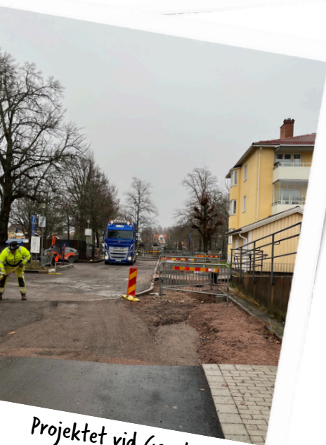
Projektet vid Gamla kyrkogatan