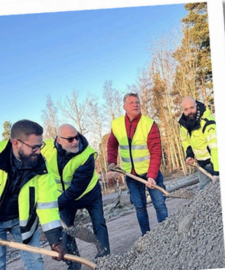
Första spadtaget till bostadsområdet Södra Sörkastet