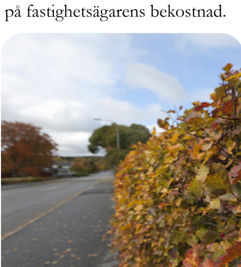
Dags att åtgärda växtlighet

I oktober tar vi över ansvaret för att klippa växtlighet på privat tomt som inte är åtgärdad. Om vi får in en ansökan om åtgärdning på privat tomt större än 1000 m 2 , så åker vi ut och bedömer om växtligheten innebär fara för trafiken. Om vi bedömer att häck, buskar eller träd behöver klippas för att det är trafikfarligt, så får fastighetsägaren ett brev där vi uppmanar till åtgärdning inom en viss tid. Om fastighetsägaren inte åtgärdar växtligheten inom den tiden kan vår entreprenör istället utföra arbetet på fastighetsägarens bekostnad.