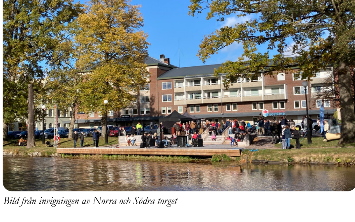
Bild från invigningen av Norra och Södra torget