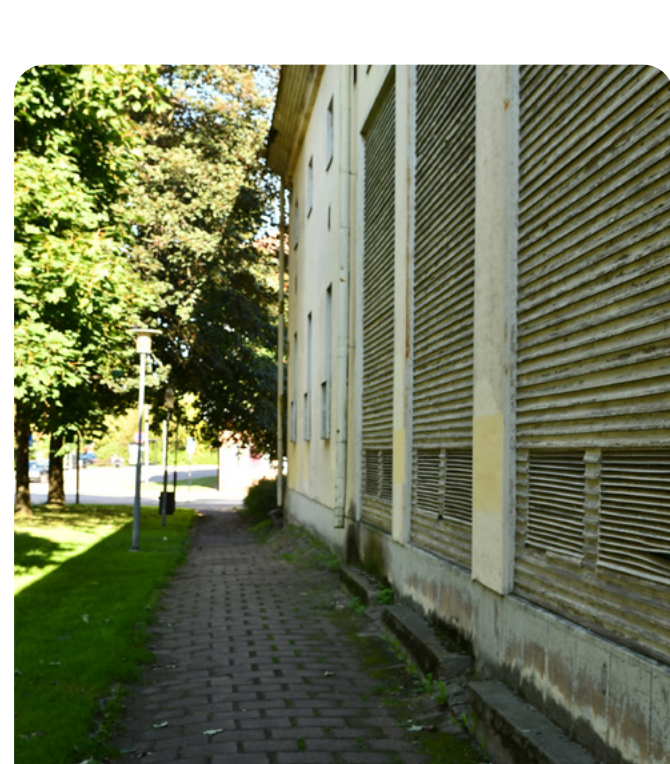
Fasadbilder på gamla elverket

Ett av våra verktyg för att utveckla stadskärnan till en ännu mer trivsamt, attraktiv och levande plats är Centrumvisionen. I visionen har tre områden i centrum pekats ut som möjliga framtida bostadsområden: Tellus (bakom stadshotellet), Sirius (Raggartorget) och Tvillingarna. Genom att riva det gamla elverket kan vi i framtiden förverkliga detaljplanen som tillåter nybyggnation av bostäder/kontor i tre våningar.