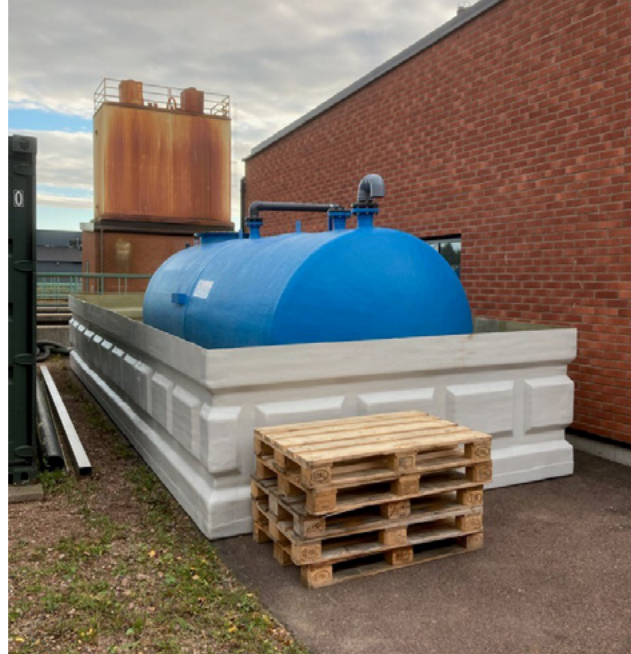
Testtanken på Fiskaretorpets reningsverk