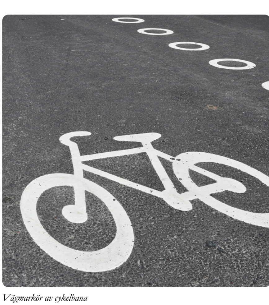
Vägmarkör av cykelbana

Arbetet beräknas påbörjas vecka 45 och bedömd kostnad är ca 600 000kr och bidraget från Trafikverket är 50 %.