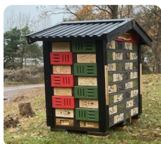
Insekshotell vid vattenverket och reningsverket

Vi har ställt ut insekshotell vid vattenverket och reningsverket. Vi har även satt ängsblommor i anslutning till dessa hotell. Det har vi gjort för att bidra till den biologiska mångfalden som en del av vårt miljöarbete.