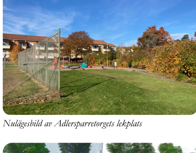
Nulägesbild av Adlersparretorget's lekplats

Hela aktivitetsparken beräknas vara färdig under våren/sommaren 2023.