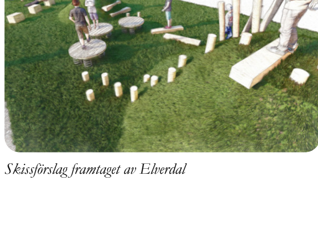
Skissförslag framtaget av Elverdal