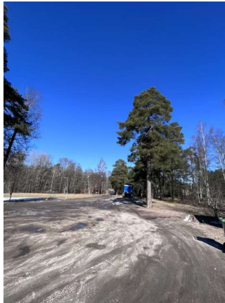
Figur 5 Foto mot norr