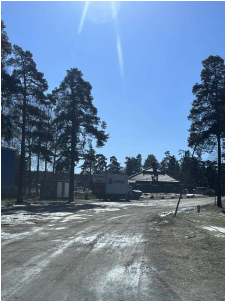
Figur 4. Foto mot söder