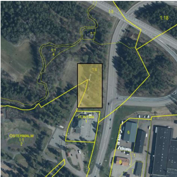
Figur 2. Flygfoto med fastighetsgränser och med ungefär områdets utbredning (gul rektangel)