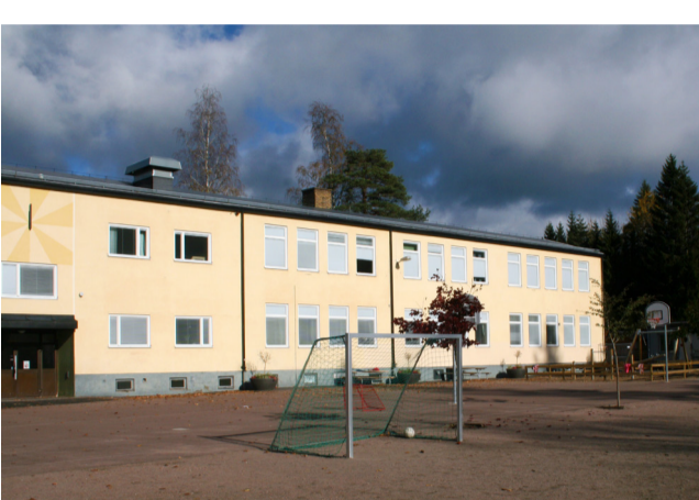
På grund av en vattenläcka på Björneborgsskolan så måste en ny vattenledning anläggas.

Försvarmakten har flyttat in i Rådhuset. Rådhuset ska belysas och arbetet för att få detta klart pågår. Försvarmakten kommer också att flagga dygnet runt utanför Rådhuset. Flaggstängen kommer därmed att belysas, det arbetet är pågående och kommer att vara klart inom kort.