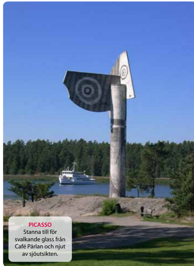
PICASSO Stanna till för svalkande glass från Café Pärlan och njut av sjöutsikten.