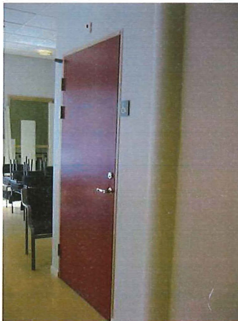
Bild 20. Exempel på kontrastmarkerad dörr.