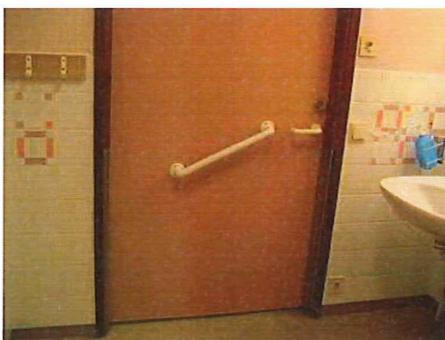
Bild 21. Exempel på kontrastmarkerad dörr. Även handtag och dörrtrycke har bra kontrast, däremot inte läsvredet.