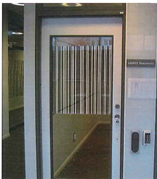
Bild 22. Exempel på markering av en glasdörr.

Enbart en högt placerad markering fungerar inte, bland annat då personer med nedsatt synförmåga ofta riktar blicken nedåt. Boverket föreslår i boken ”Enklare utan hinder” att två markeringar görs, cirka 1,5 meter respektive 90 centimeter över golvet, eller att hela ytan i detta intervall markeras. Se vidare från sidan 75 i boken Enklare utan hinder.